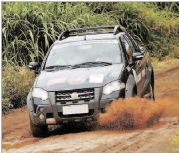
Fiat durante provas na temporada 2012: evento chega a Piracicaba

A programação começa às 13 horas com a entrega das doações (quatro latas de leite em pó por pessoa, inclusive o Zequinha/carona), a retirada dos kits (camisetas e adesivos) e customização das camisetas (gratuito). Os inscritos não devem se esquecer de levar duas