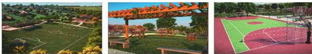
Perspectivas de campo de futebol gramado, playground e quadra poliesportiva. Estrutura de lazer é destaque no projeto do Campos do Conde Taquaral.